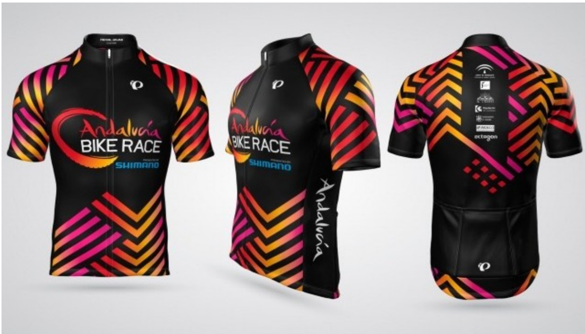
Maillot Oficial ABR 2018