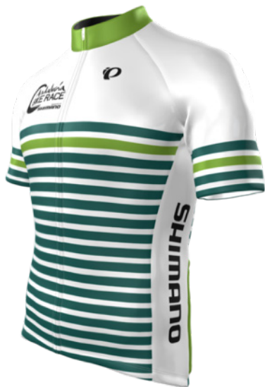
Maillot de Líder Oficial ABR 2018

El diseño del maillot de Líder y el maillot Oficial de la prueba marcará la diferencia entre todos los participantes por las tierras andaluzas.